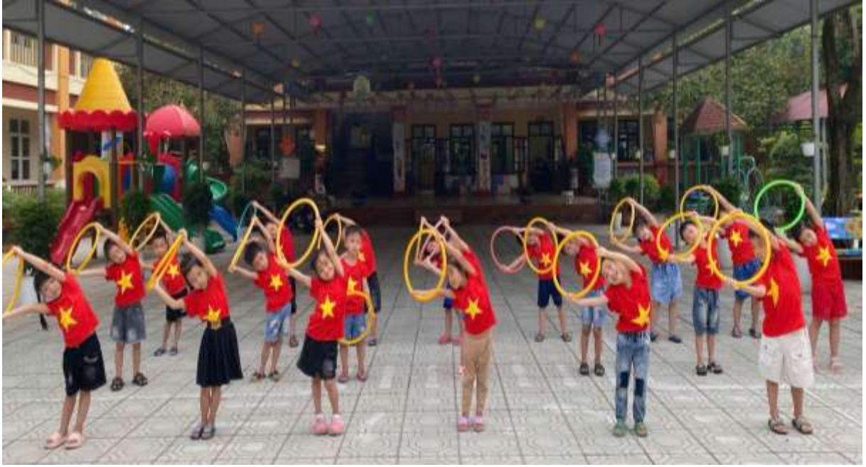
Hình ảnh: Hoạt động thể dục sáng của trẻ