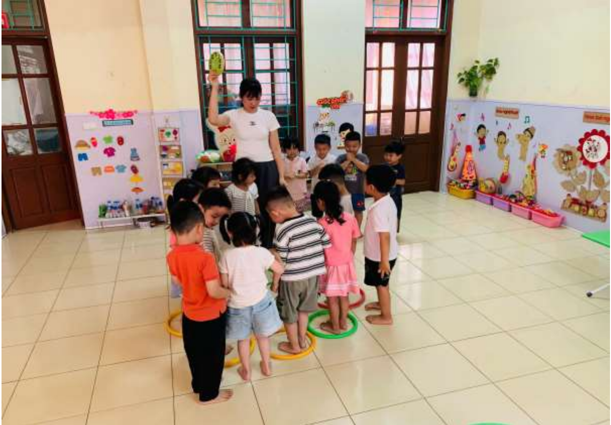
Hình ảnh trẻ chơi trò chơi “Ai nhanh nhất”.

Trò chơi: “Ai nhanh nhất” Cô cho trẻ nghe một bài hát trẻ vừa đi vừa hát theo giai điệu bài hát. Khi có tín hiệu trẻ nhanh chân chạy về chuồng. Thông qua trò chơi trẻ kiểm soát được tốc độ của mình, trẻ thấy vui khi mình làm được, trẻ thấy buồn khi mình làm chưa được.