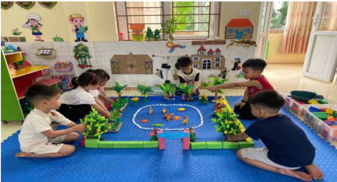
Hình ảnh trẻ chơi góc xây dựng

Toàn bộ nhóm cùng làm việc trong trạng thái say mê, cố gắng hoàn thành “công trình xây dựng” theo nhiệm vụ được giao. Hoạt động không chỉ giúp trẻ hiểu hơn về nghề xây dựng mà còn góp phần phát triển kỹ năng giao tiếp, hợp tác và thể hiện cảm xúc tích cực trong quá trình chơi.