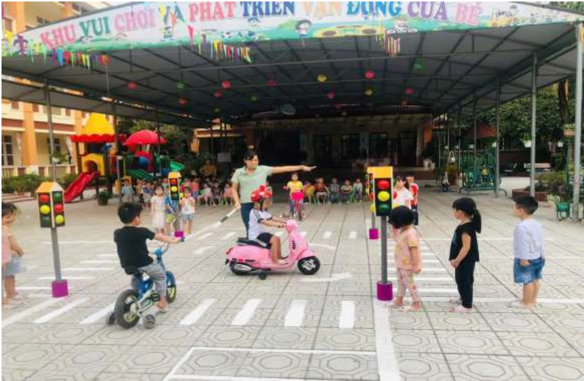
Hình ảnh trẻ chơi ngoài trời.