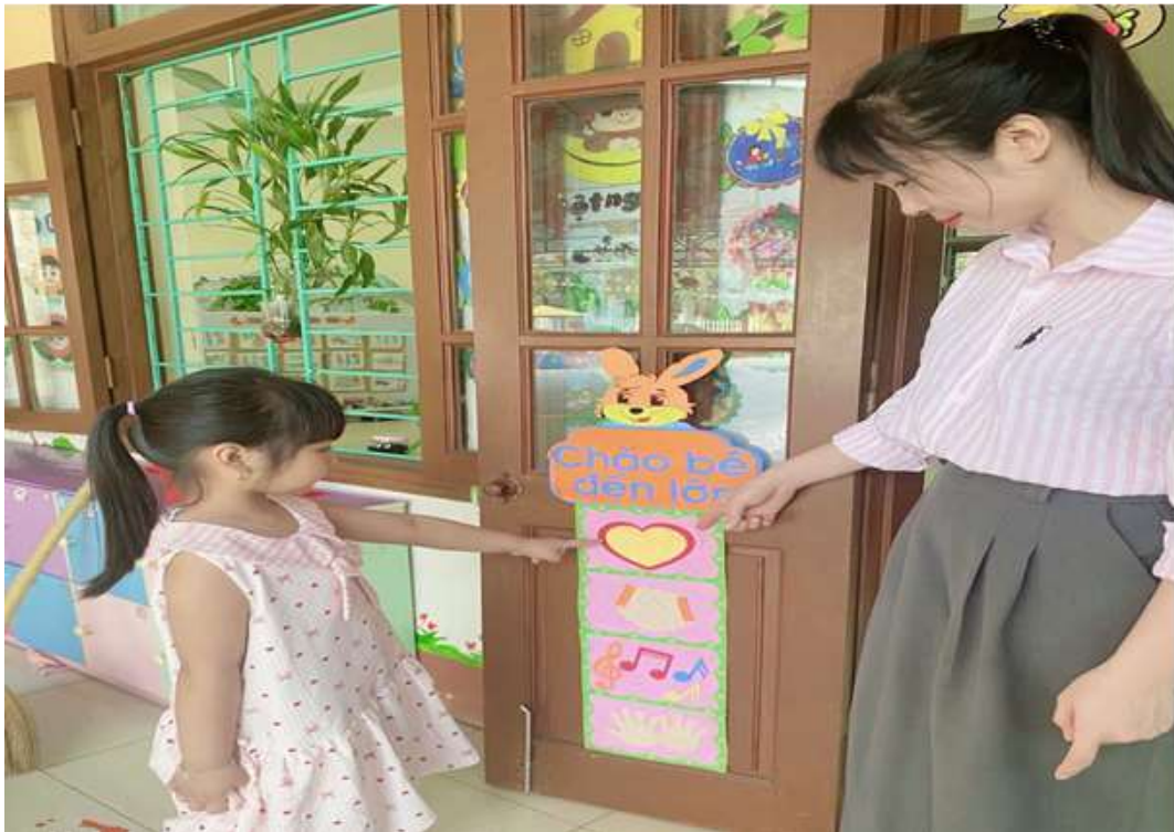
Hình ảnh: Giờ đón trẻ và gợi ý trẻ lựa chọn cảm xúc trước khi vào lớp.

Tạo môi trường lớp học thân thiện là yếu tố trực tiếp tác động hàng ngày khi trẻ đến trường. Một môi trường cởi mở niềm nở vui vẻ sẽ tác động đến việc học tập tốt, có hiệu quả là môi trường gây hứng thú, phát huy được trí tưởng tượng, sáng tạo của trẻ. Đó là nơi đáp ứng tốt nhất sự phát triển tình cảm kỹ năng cảm xúc của trẻ. Chính vì vậy trang trí môi trường đón trẻ vào lớp học luôn được tôi quan tâm hàng đầu. Bên cạnh cửa lớp tôi đã trang trí góc cảm xúc của trẻ, mỗi khi trẻ đến lớp tôi gợi ý để trẻ lựa chọn cảm xúc của mình khi mới đến lớp.