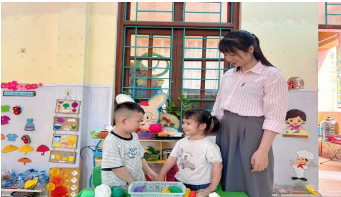
Hình ảnh cô giáo gợi ý để trẻ cùng vào vai “Người bán hàng” ở góc phân vai.

Ví dụ: Trong nhóm “Bán hàng” xảy ra tình huống tranh giành là “Người bán hàng”, lúc này với vai trò cố vấn cho người “Bán hàng”, giáo viên có thể điều chỉnh bằng cách yêu cầu trẻ cùng trong vai “Người bán hàng”, gợi ý để trẻ cùng nhau chia sẻ công việc một cách vui vẻ và thoải mái.