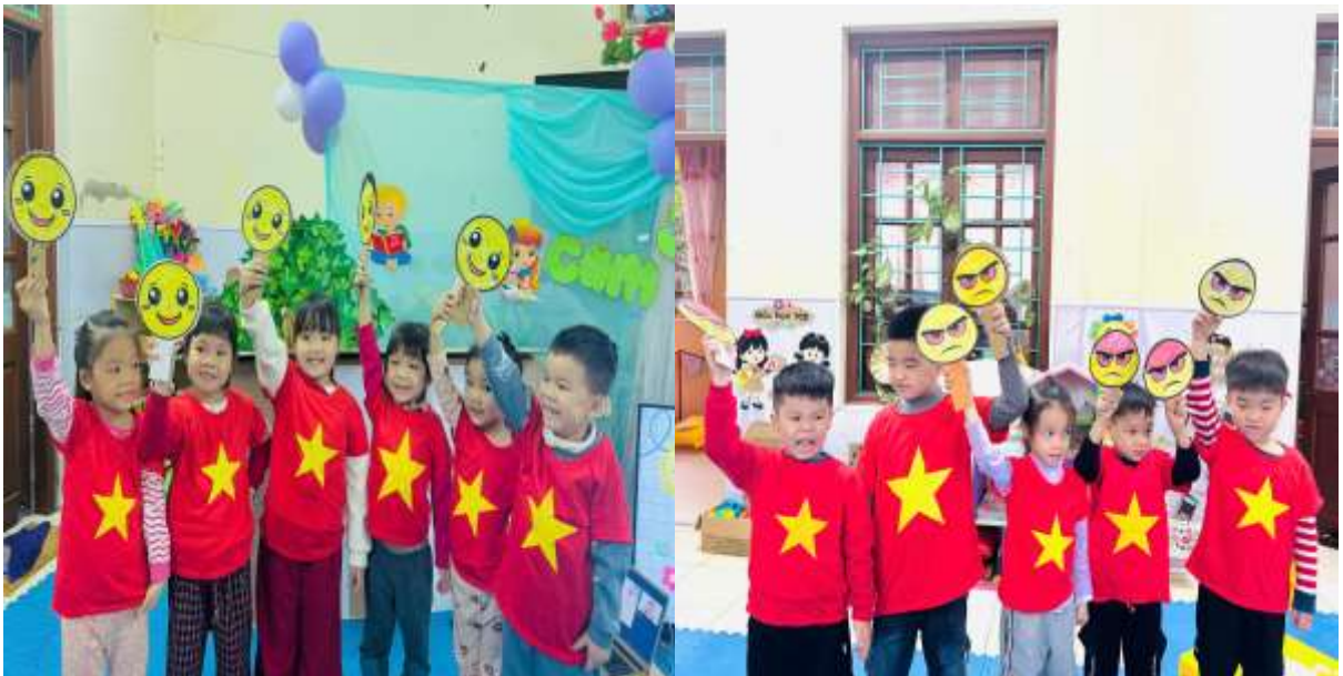
Hình ảnh trẻ chơi trò chơi thể hiện cảm xúc theo icon mà trẻ chọn.

Ngoài ra, giáo viên còn sử dụng tranh ảnh, video, câu chuyện, trò chơi tình huống và các biểu tượng cảm xúc để trẻ dễ dàng nhận biết các trạng thái cảm xúc khác nhau. Trong các hoạt động học và chơi, giáo viên khuyến khích trẻ mạnh dạn bày tỏ suy nghĩ, cảm xúc của mình với cô và bạn bè, từ đó giúp trẻ tự tin hơn trong giao tiếp.