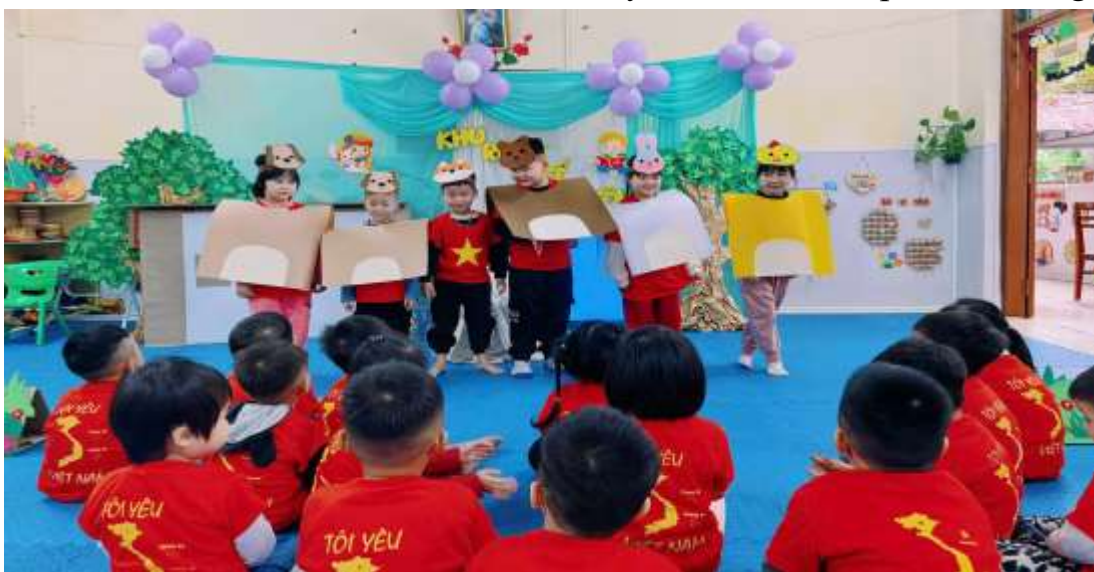
Hình ảnh trẻ đóng kịch kể chuyện: “Cáo, thỏ và gà trống”.

Trẻ được tự lựa chọn nhân vật trẻ yêu thích để nhập vai và đóng vai.