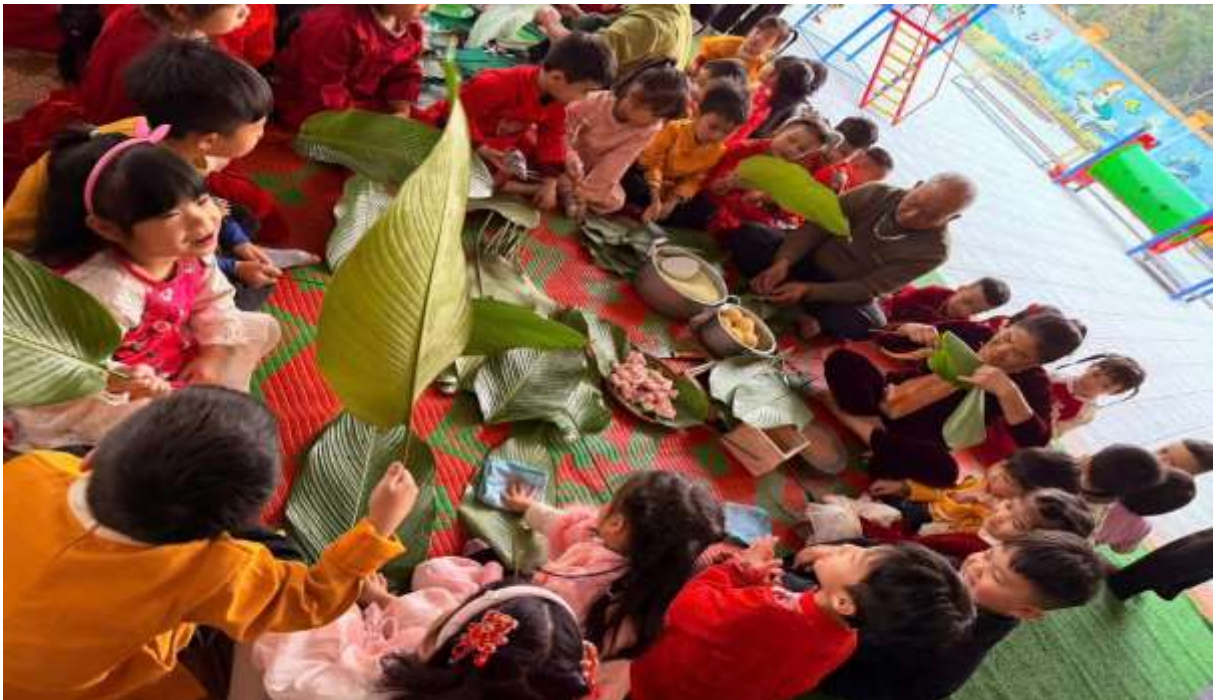
Hình ảnh trẻ trải nghiệm gói bánh chưng ngày Tết.