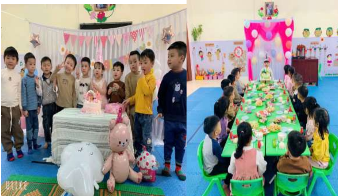
Hình ảnh cô tổ chức sinh nhật cho trẻ tại lớp.

Để tạo sự nhất quán giữa nhà trường và gia đình trong chăm sóc và giáo dục trẻ, đặc biệt là giáo dục cảm xúc cho trẻ cần phải có sự phối hợp giữa giáo viên và cha mẹ, nên trong những buổi họp hoặc khi đón trả trẻ tôi trao đổi với cha mẹ về vai trò quan trọng của việc giáo dục cảm xúc cho con mình. Mời cha mẹ tham gia vào hoạt động của trẻ tại trường (ngày 8/3, mừng sinh nhật bạn, giúp đỡ các bạn khó khăn...).