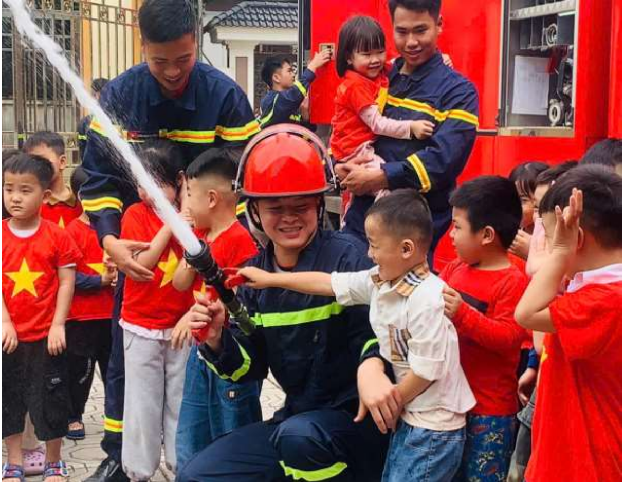
Hình ảnh trẻ tham gia hoạt động trải nghiệm: “Tuyên truyền trải nghiệm, thực hành phòng cháy chữa cháy và cứu nạn cứu hộ”.

người xung quanh. Từ đó, trẻ hình thành những phẩm chất tốt đẹp, phát triển toàn diện cả về kỹ năng sống và cảm xúc xã hội.